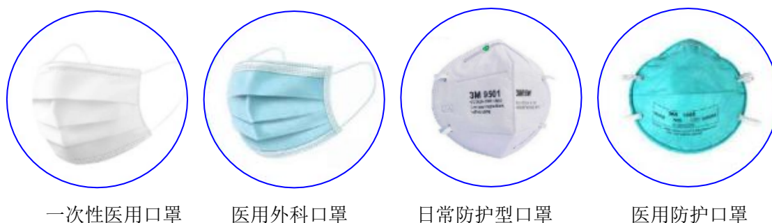
图 1 常见的口罩类型

根据适用范围的不同，纳入标准范围且可用于新型冠状病毒预防的口罩主要包括一次性使用医用口罩（YY/T0969 - 2013）、医用外科口罩（YY 0469 -2011）、日常防护型口罩（GB/T 32610 - 2016）和医用防护口罩（GB 19083 -2010）（图 1）。