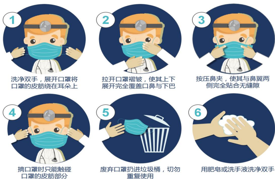
图 3 口罩正确佩戴方法图示