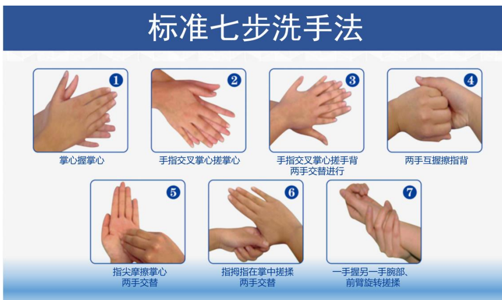
图 4 标准“七步洗手法”

正确洗手的方法，先是干净的自来水彻底润湿双手，然后关闭水龙头并使用清洁剂进行清洗，再按标准“七步洗手法”搓洗双手（见图 4），之后在干净的自来水下彻底冲洗双手。最后用干净的毛巾擦干双手、用烘干器或自然风干。